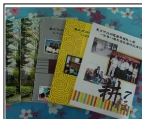
教師教學研究專輯