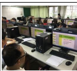
教師參加電腦研習