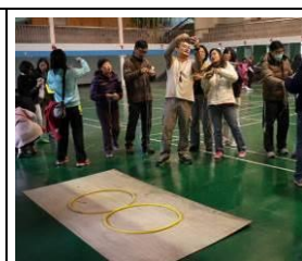
領域備課社群校內分享